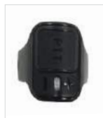
PTT inalámbrico de dedo