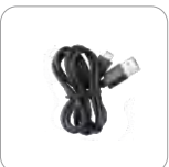
Cable Tipo C (Ap516)