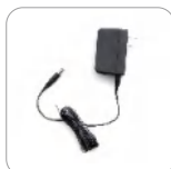
Adaptador de energía 12 V/1 A (Ap586)