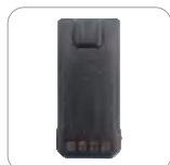
Batería de Li-ion 1500 mAh (Ap586)