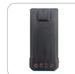
Batería de Li-ion 2000 mAh (Ap586)