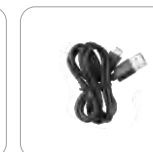
Cable Tipo C (Ap586)