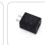
Adaptador de energía (USB) (AP586)