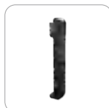
Clip para el cinturón