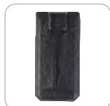
Batería de Li-polímero 4000 mAh (Ap516)