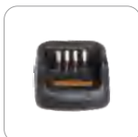
Cargador rápido MUC (Ap586)