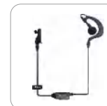
Auriculares tipo C