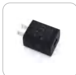
Adaptador de energía (USB) (Ap516)